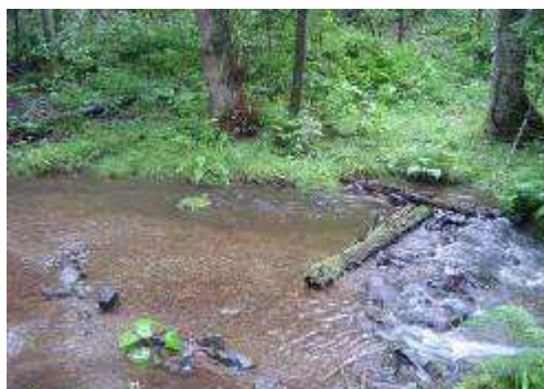
Frayère naturelle au Seebach

« RDV OPERATION LAC et RIVIERE PROPRES : le 17 MAI 2008 place de la mairie à Lautentach-Zell à 9 h. Merci de vous associer à nous. »