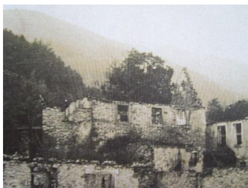
Photo de la chapelle détruite en 1914 côté Linthal