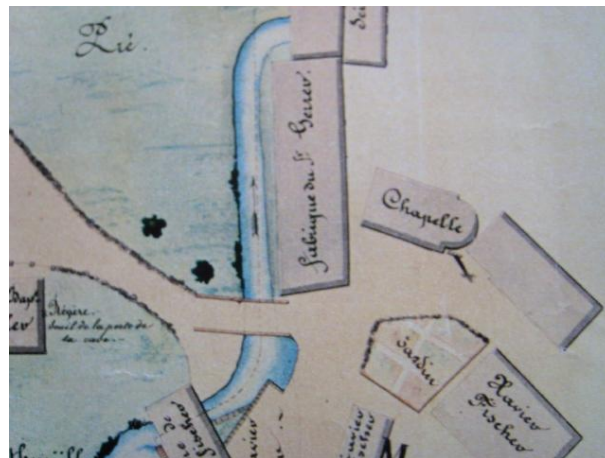
Plan cadastral de 1825

Histoire : Bien avant la construction de l'église la chapelle représentait le lieu de culte au centre du hameau. Vers 1500, mention d'une chapelle Saint-Nicolas. Construction d'une chapelle en 1628, d'après une inscription qui se trouvait au-dessus de la porte d'entrée. (Mentionnée par le curé Kraus qui la décrit comme un édifice construit en style gothique tardif comprenant un vaisseau avec fenêtres et arc triomphal en plein cintre). La chapelle figure sur le cadastre de 1825, située près du ruisseau « Felsenbach ». (Ruisseau qui se jette dans la Lauch). Elle est détruite lors de la grande guerre par l'assaut et le bombardement de Sengern et du Höffen le 25 octobre 1914 par les Wurtenbourgeois.