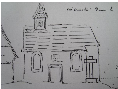
Croquis de l'abbé Weber