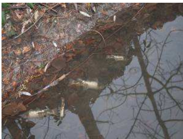
Ruisseau du Wiedersbach, janvier 2009, découverte de truitelles mortes victimes des rejets urbains. Plus jamais ça....